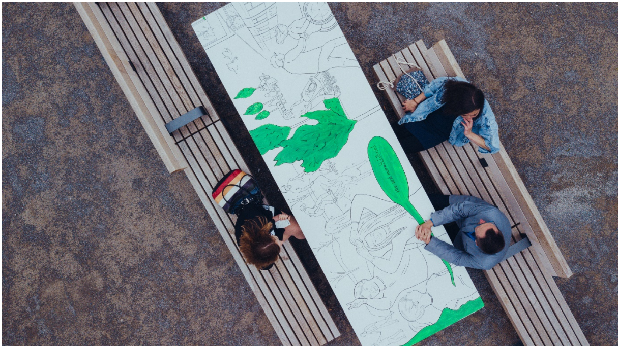
HIER SIND MEINEHELDEN von Johanna Regger