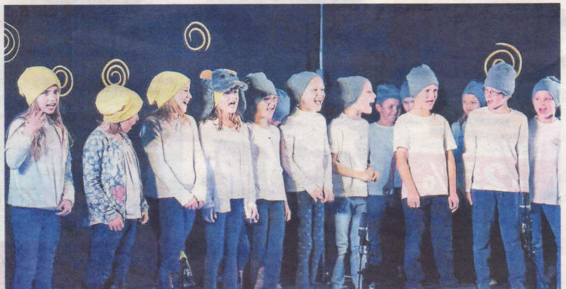
Volles Engagement der Darsteller: Das Kinderrechte-Theater „Wirbelsturm im Mützenland“ in der Seifenfabrik begeisterte Akteure und Zuseher.

Die Veranstalter konnten auch Erkenntnisse sammeln, die man sofort umsetzen will: „Uns ist unter anderem das Thema Gewalt in Familien und das Recht auf eine gewaltfreie Erziehung aufgefallen, da gilt es sicher, noch einmal genauer hinzusehen und vielleicht noch weiter zu sensibilisieren“, sagt Schiffrer-Barac. S. Haller