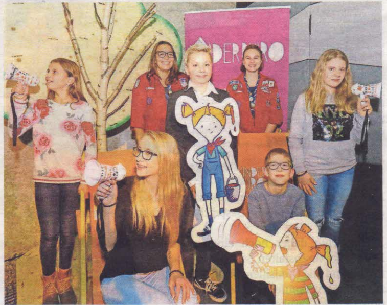
Bei der TrauDi!-Preisverleihung wurden Kids für ihr Bemühen in Sachen Kinderrechte geehrt.