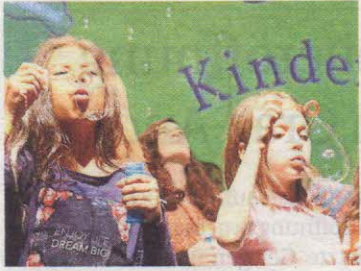
Die Gala der Kinderrechte im Dom im Berg